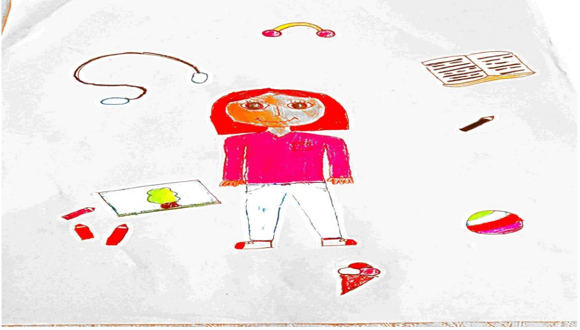
Bridging Cultures projesi için kendimizi ve hobilerimizi tanıtmaya etkinliğimiz