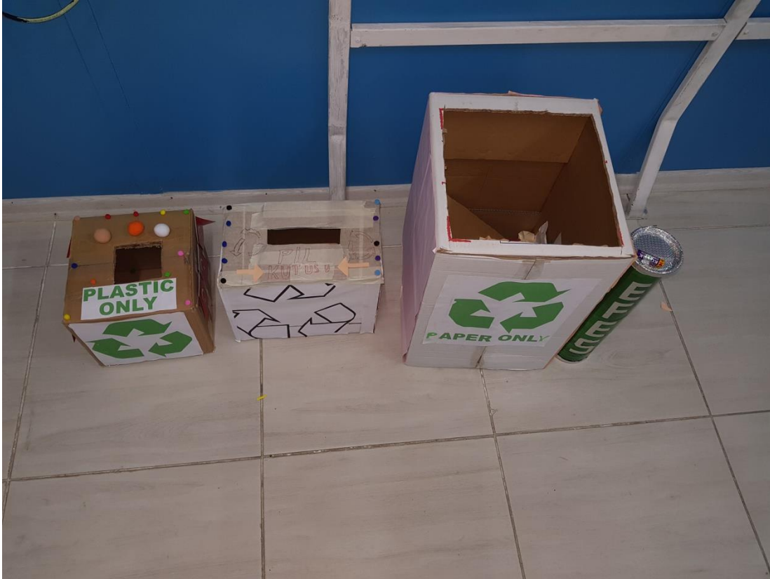
Eco Friendly Eco Schools Projesi için tasarladığımız geri dönüşüm kutularımız