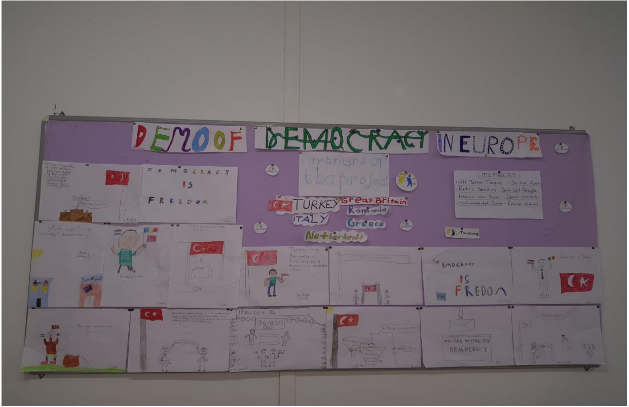
Demo of Democracy projesindeki panomuz